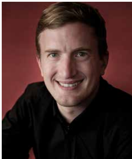
Stefan Büsser - Comedian

Als Comedian steht er landesweit auf der Bühne. Pointe reiht sich an Pointe. Stefan Büsser überzeugt durch Witz und Schlagfertigkeit. Unerwartete Querverbindungen, skurrile Wendungen und Gedankensprünge jagen sich Schlag auf Schlag. Von der Fachjury der Sonntagszeitung wurde er im Comedy-Ranking in die Top-10 der Schweizer Komiker gewählt und ist Vize-Sieger des „Swiss-Comedy-Award“. Stefan Büsser gehört zum Moderatorenteam von SRF3 und ist mit über 100'000 Fans auf Facebook einer der beliebtesten Comedians der Schweiz im Netz. Mit seinen „Best of“ der Sendung „Bachelor“ und „Bachelorette“ erlangte er endgültig Kultstatus.