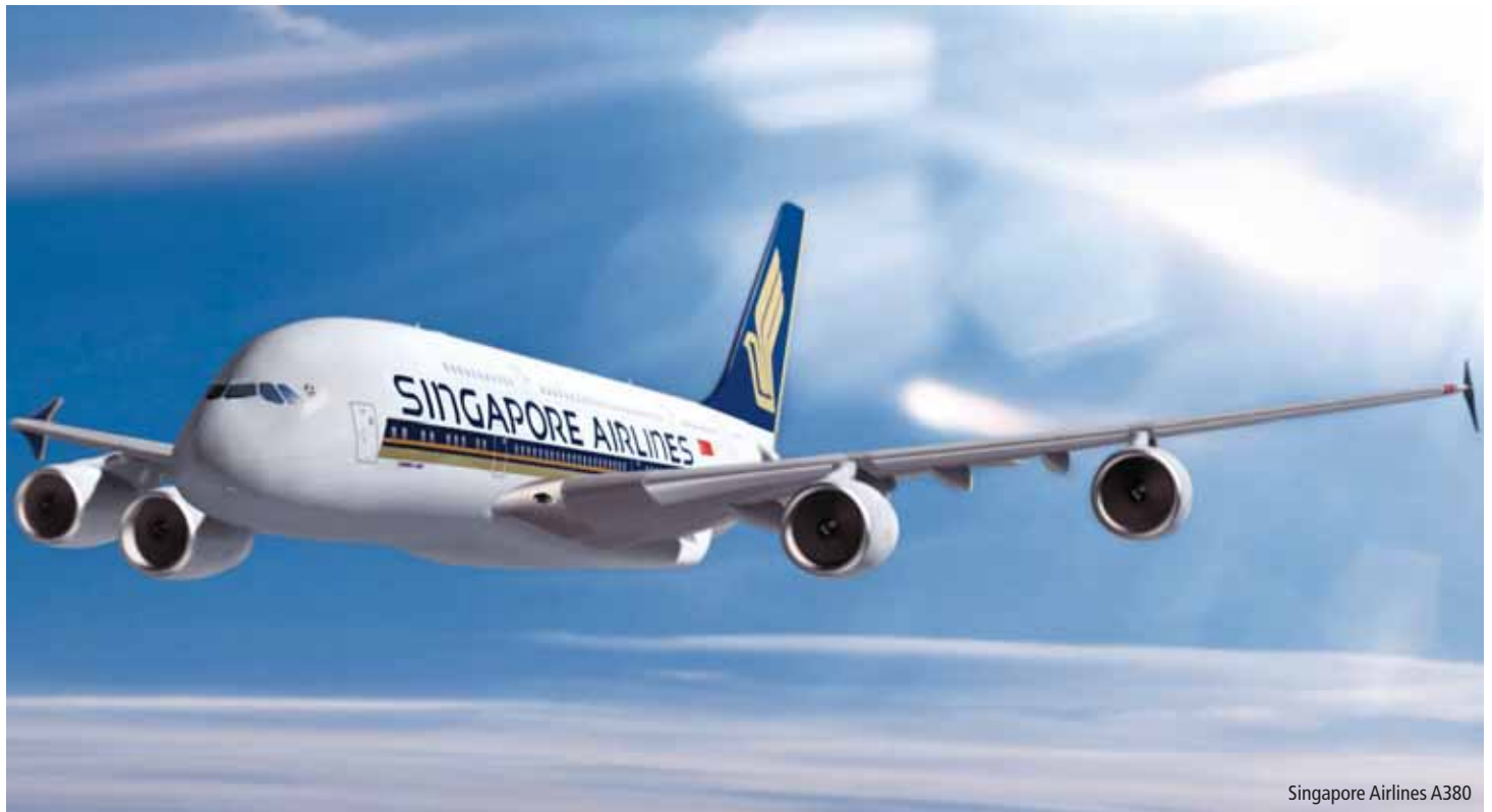
Singapore Airlines A380

Singapore Airlines ist die am häufigsten ausgezeichnete Fluggesellschaft der Welt und steht für höchste Qualität. Freuen Sie sich auf die typisch asiatische Gastfreundschaft, sobald Sie in Zürich im Airbus A380 Platz nehmen. Das Kabinenpersonal verwöhnt Sie während des ganzen Fluges und macht Ihren Aufenthalt an Bord zum unvergesslichen Erlebnis. Lehnen Sie sich zurück, geniessen Sie den exzellenten Service, leckere Mahlzeiten und ein riesiges Unterhaltungsprogramm mit topaktuellen Filmen, Serien, Musik und Spielen.