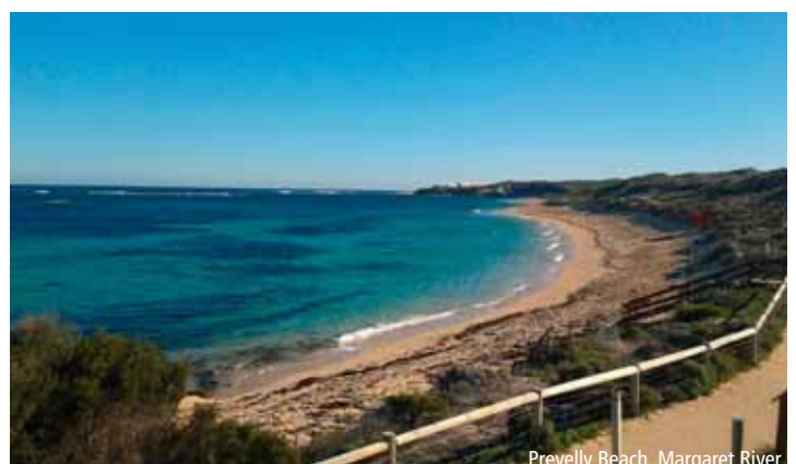
Prevelly Beach, Margaret River

Weitere Informationen auf Seite 100 im knecht reisen Katalog.