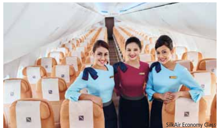
SilkAir Economy Class