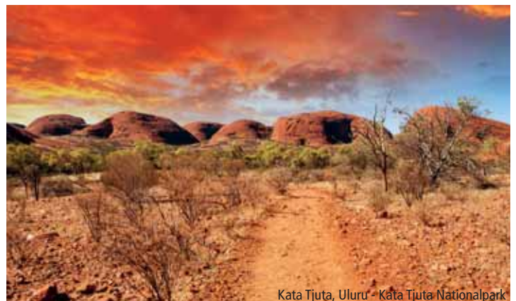
Kata Tjuta, Uluru - Kata Tjuta Nationalpark

Weitere Informationen auf Seite 102 im knecht reisen Katalog.