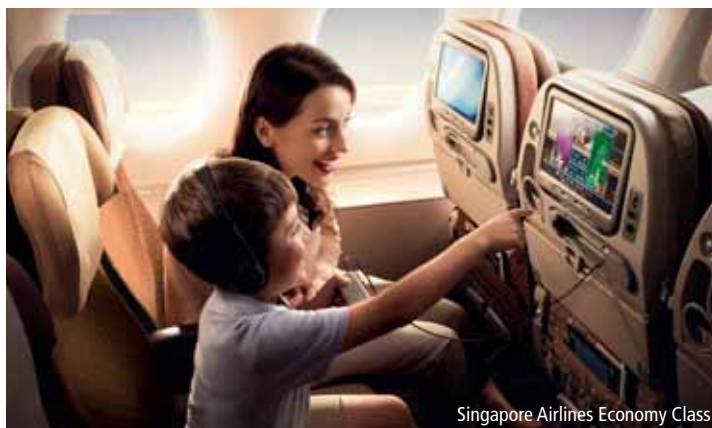
Singapore Airlines Economy Class