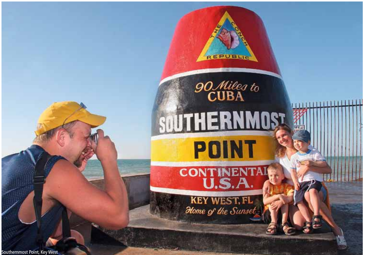
Southernmost Point, Key West