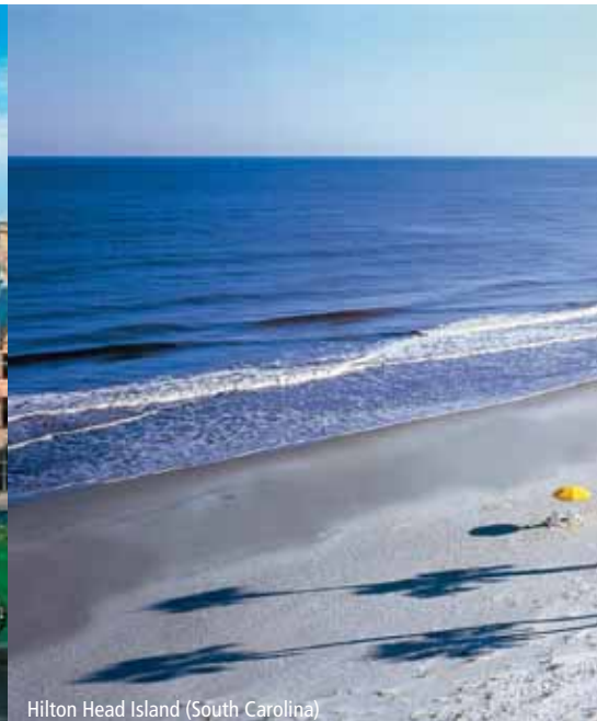
Hilton Head Island (South Carolina)