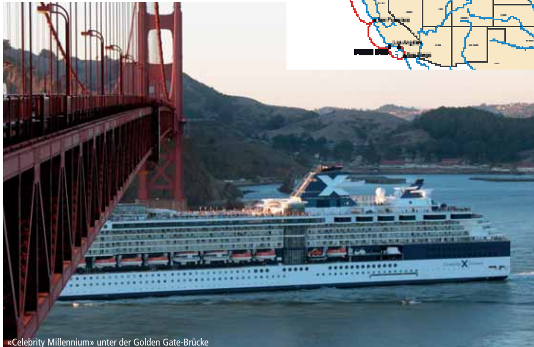
«Celebrity Millennium» unter der Golden Gate-Brücke